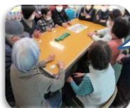
おしゃべりひろば♪