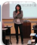
発達凸凹ちゃんってなに？