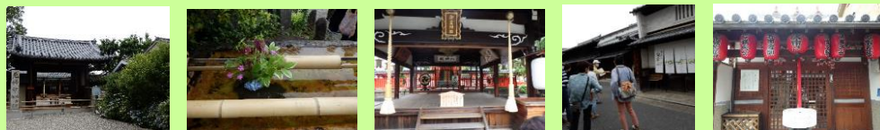
国宝 元興寺 花手水 御霊神社 ならまち散策 庚申堂

観光ボランティアさんと「元興寺」「御霊神社」「庚申堂」「吉田蚊帳」など2時間でならまちを散策、その都度由来や歴史のお話を伺い、お店も散策して、楽しみました。最後に中西ピーナツでおすすめのピーナツペーストをお土産に福祉会館へと向かいました。