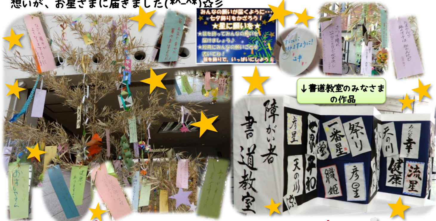
↓書道教室のみなさまの作品

総合福祉会館では、毎年、笹を提供していただき七夕飾りを行なっています。 今年も利用者みなさまのご協力により、笹が綺麗に飾られました！ また、今年は障がい者創作活動教室の書道教室の方に願いを書いていたものを 屏風風のパネルに貼りロビーに飾りました！ 想いを川柳にしたためたもの、家族への想い、平和への願いなど、みなさまの沢山の 想いが、お星さまに届きました(*^-^*)☆