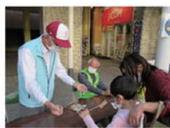
昔あそびを楽しもう！