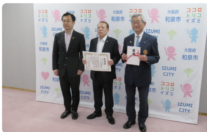
和泉市役所にて義援金の贈呈式(株式会社西辻工務店様)