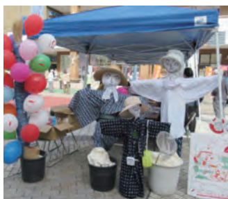
昔あそび(アムゼモール)