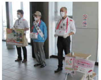
街頭募金(和泉府中駅)