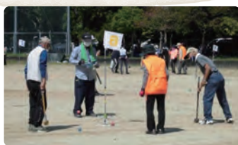
市老連グラウンド・ゴルフ大会