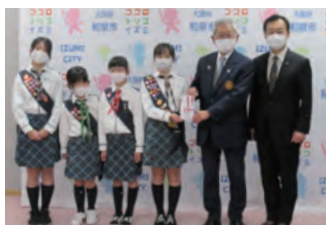
ガールズスカウト大阪府第28団