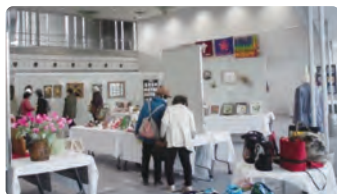
すこやか文化祭作品展