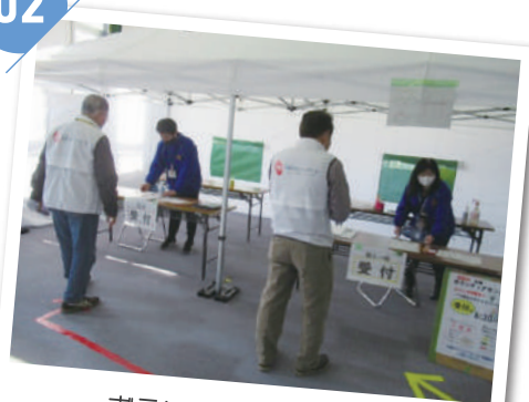
ボランティア受付の様子