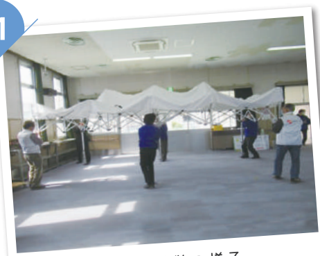
テント設営の様子