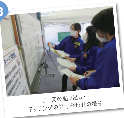
ニーズの貼り出し・マッチングの打ち合わせの様子