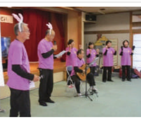
団体活動(キラキラ星)