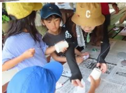
紙コップで コケッココー