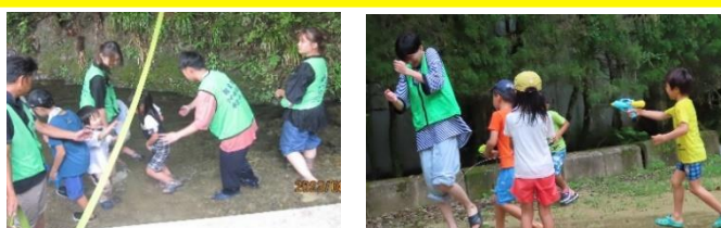
イベントサポート (夏休み親子ふれあい日帰りキャンプ)