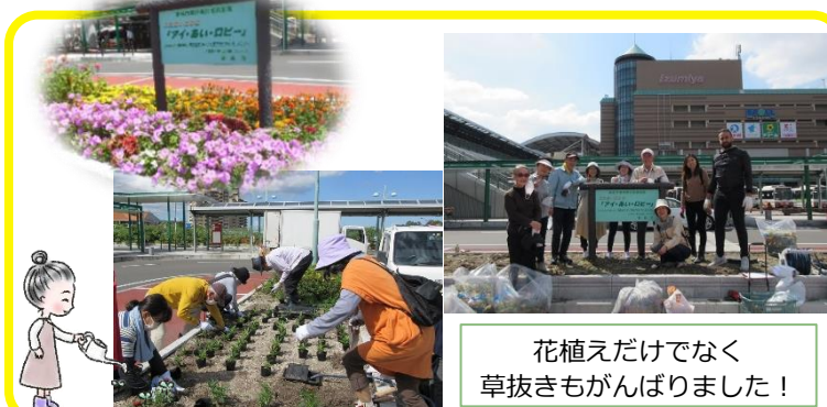
花植えだけでなく 草抜きもがんばりました!