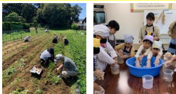
福祉農園のお手伝い (ジャガイモの収穫、白みそ作り)