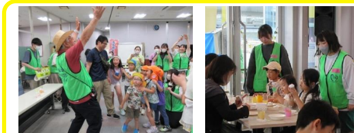
イベントサポート (ももやまキッズランド)