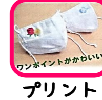
プリント ワンポイントがかわいい