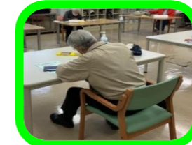
カレンダーづくり 会館の案内