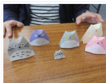
障がい者(児)折り紙講座