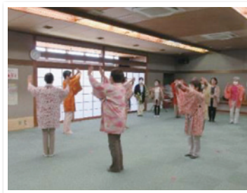
槇尾山幟上げ音頭講座