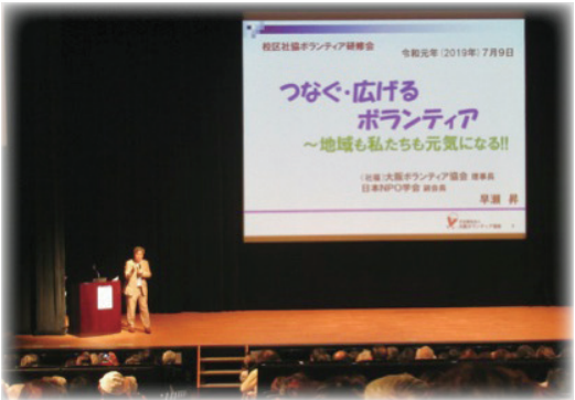
校区社協ボランティア研修会の様子