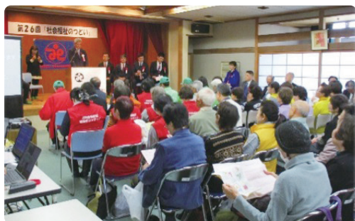
(令和元年度の式典の様子)