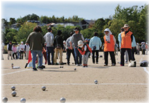
シニアペタンク大会の様子

※赤い羽根共同募金で集まったご寄付は、大阪府共同募金会を通じて和泉市社会福祉協議会へ配分されます。