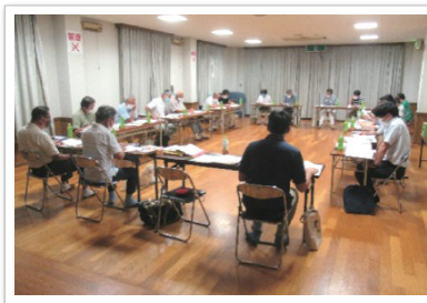
※南松尾はつが野校区協議の場の様子