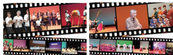
(令和元年度の様子)

新しい生活様式が必要になって、人が集まり、ふれあい、顔を合わせて交流することが難しくなっています。そのような中でも、今までに培ってきた地域活動やつながりを絶やさないために、自分たちに何ができるのかをみんなで考えてみませんか。