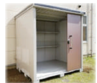
北部総合福祉会館