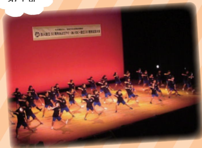
オープニング（石尾中学校ダンス部）