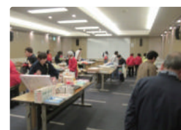
当日の式典会場やバザーの様子です