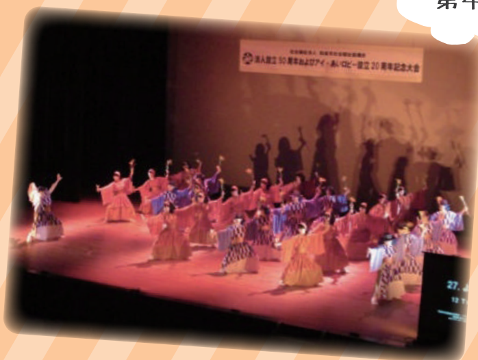
ボランティアフェスティバル