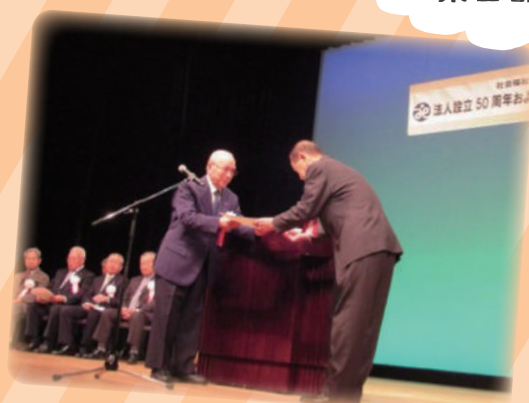
記念式典（賞状の贈呈）