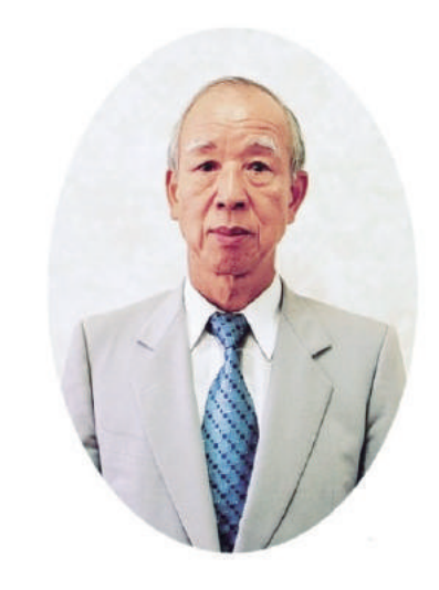
【講師紹介】 ◆日本ソーシャルワーカー協会 副会長 他