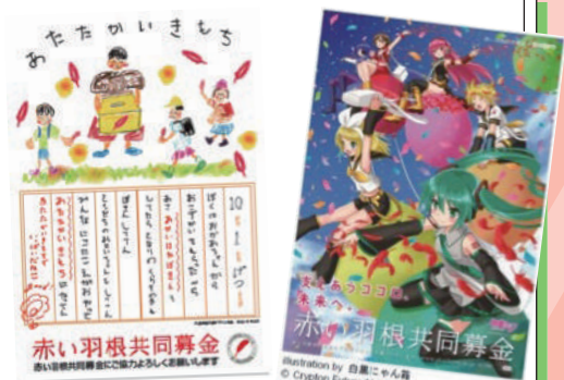
今年の赤い羽根共同募金のポスターです。