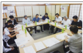
①ワークショップでの話し合いの風景です