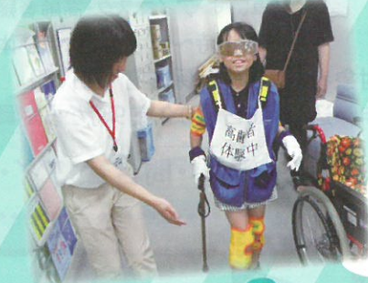
左・右上:夏休み親子ふれあい日帰りキャンプの様子 右下:夏休み親子福祉体験講座の様子