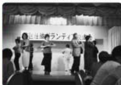
日頃の練習の 成果を発表！