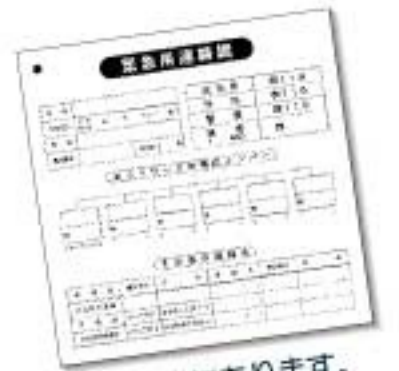
市社協にあります。お気軽にご相談ください。

公民館や集会所等で、ボランティアが参加者とともにレクリエーションや健康体操、おしゃべりなど楽しく活動しています。主に高齢者等が対象の「いきいきサロン」と、子育て中の親子が対象の「子育てサロン」があります。