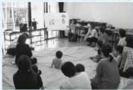
子どももたくさん参加し、盛り上がりました。

そこで、8月8日(水)に「子育てサロン情報交換会」を開催しました。当日は、参加した子育てサロンの方々からいろいろな声や実情を聞くことができ、あつという間に時間が過ぎました。今後も、継続的に開催することを検討して欲しいとの意見も頂きました。子育てサロンに興味のある方は、ぜひ一度市社協へご相談ください。