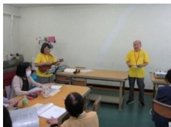
レクリエーションを通じて参加者を 楽しませるボランティア活動