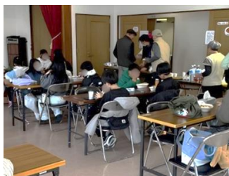
多世代が参加することも食堂の 立ち上げと運営