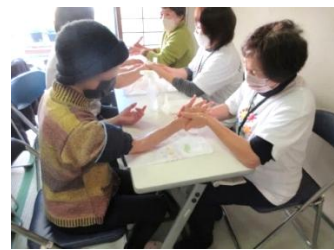
参加者の心を癒すハンドマッサージの ボランティア活動