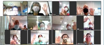
リモート会議で活動のPR