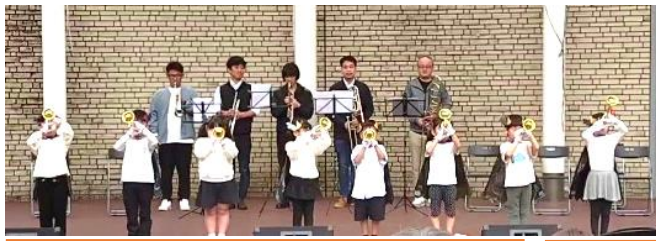
いぶきのPreSchoolとmorimoto 音楽堂の みなさんのファンファーレでスタート