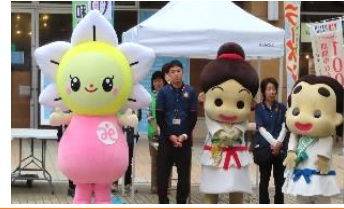
和泉市社協マスコットキャラクター スマイルすいちゃん、デビューです！