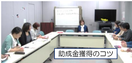
助成金獲得のコツ

NPO 法人のための税理士相談 助成金情報、申請のお手伝い 和泉市市民活動推進支援金申請のお手伝い