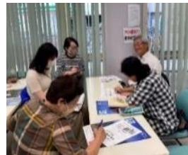
キャッチコピーの 作り方講座

広報力アップのための各種講座の開催 チラシ・ポスターの掲示やホームページ掲載を 代行します