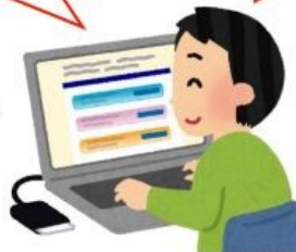
仕事のスキルや知識、 経験を活かして協力する ボランティアさん