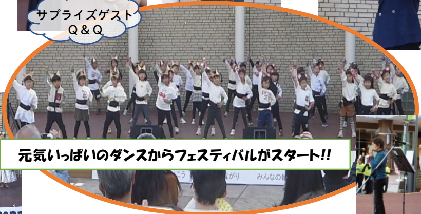
元気いっぱいダンスからフェスティバルがスタート!!